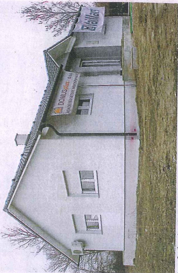
Izgrađen je pokazni model niskoenergetske montažne kuće korisne neto površine 81,73 m 2

Osim niskoenergetskog življenja, kao glavne adute stanovanja u gradiću poznatom po specijalnoj bolnici Naftalan, ističu izvrsnu prometnu povezanost s obližnjim Zagrebom, širenje poduzetničke zone i očuvanu prirodu.