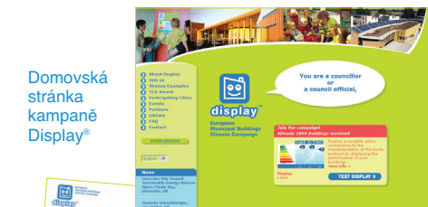
Domovská stránka kampaně Display®